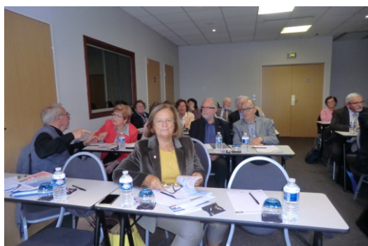
Réunion Émulation civique inter-ADAMA qui s'est tenue à Forges les eaux le 5 Octobre 2017

Étaient excusées les départements 50, 53 et 61.