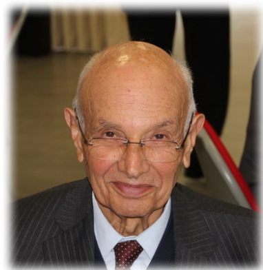
Réalisation : A. COZETTE

Membre de notre association depuis 2002 et Maire Adjoint Honoraire de Rouen.